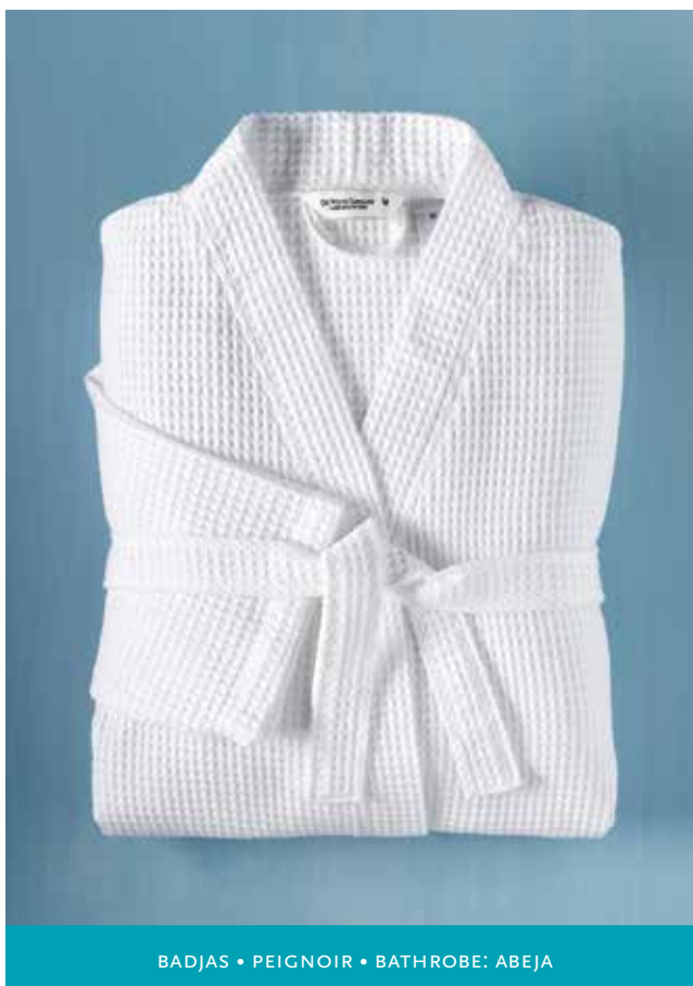
BADJAS • PEIGNOIR • BATHROBE: ABEJA