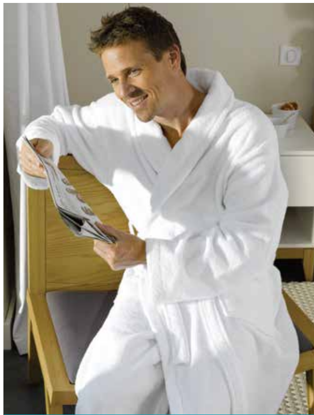
BADJAS • PEIGNOIR • BATHROBE: BELAGIO