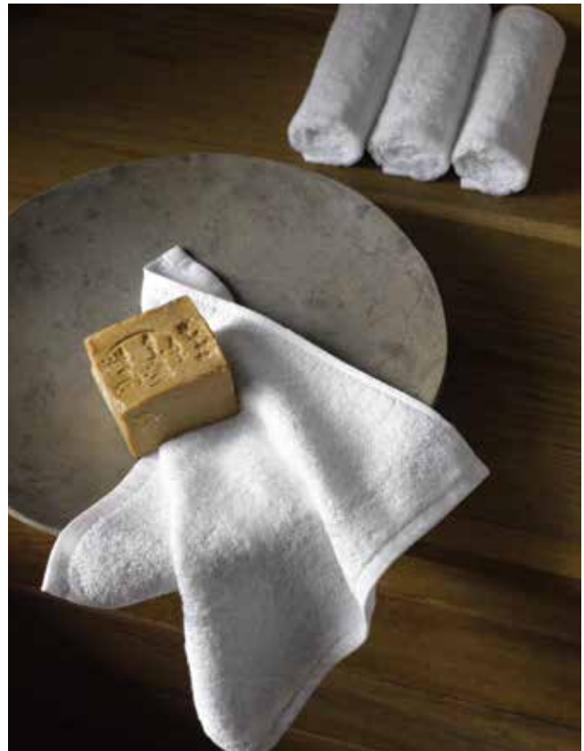
WASLAPJE • BARBOUILLETTE • WASH CLOTH: PONSAS