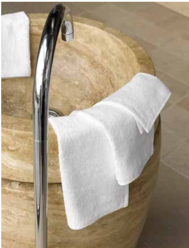
WASLAPJE • BARBOUILLETTE • WASH CLOTH: MERCATOR