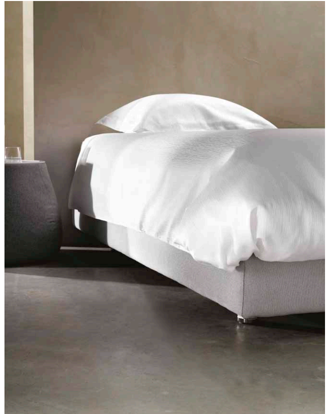
DONSDEKENOVERTREK EN KUSSEN • HOUSSE DE COUETTE ET TAIE D'OREILLER • DUVET COVER AND PILLOW CASE • COLOUR: WHITE