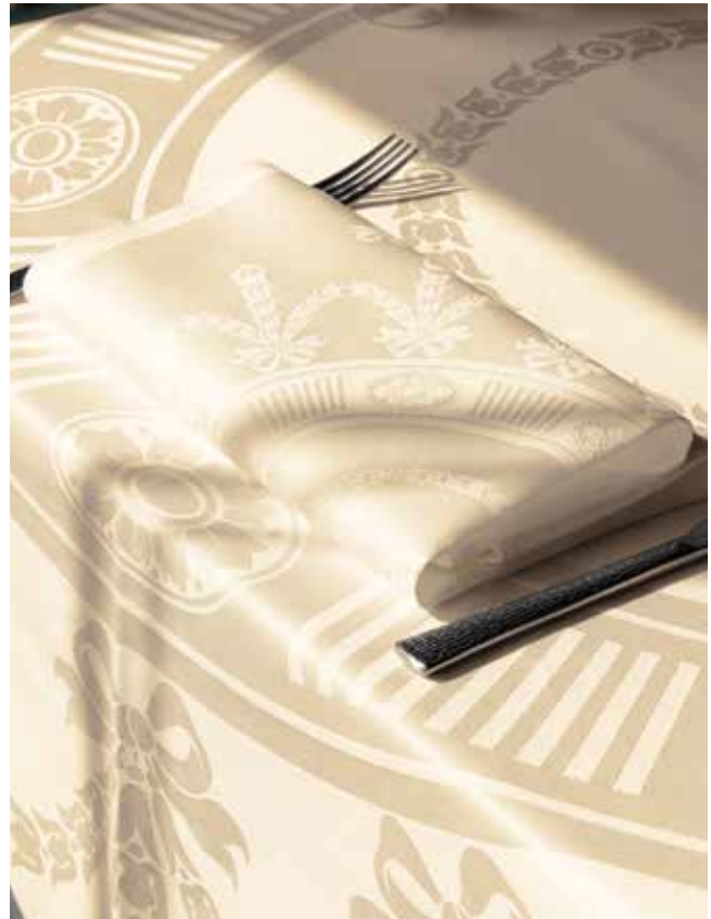
TAFELKLEED & SERVET • NAPPE & SERVIETTE • TABLE-CLOTH & NAPKIN, COLOUR: WHITE/CHAMPAGNE